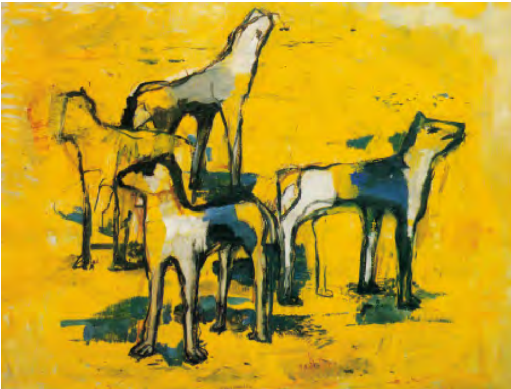
Ingens hundar 1958 (138 × 105 cm)