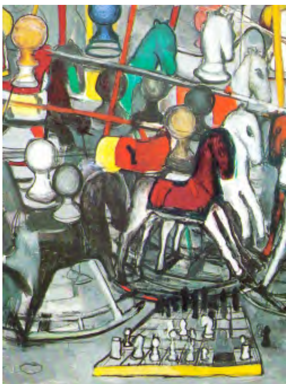
Gunghästar i batalj (detalj) 1971-1972

Staffans Hallström var en passionerad amatörschackspelare. Utöver hundar var därför schack en vanligt motiv i hans målningar. Det finns till och med några verk där hundarna promenerar på ett schackbräde. Även gunghästar var ett vanligt motiv. Åren 1971-1972 arbetade han på ett verk kallat Gunghästar i batalj för dåvarande Civildepartementet. Från början hade Hallström tänkt sig att konstverket skulle utföras i textilt material av Handarbetets vänner , men till slut bestämde han sig för en olja i det imponerande formatet 398 × 215 cm. Bakgrunden består av massor av gunghästar, schackhästar och schackbönder – i förgrunden ett schackbräde med en ställning efter några få drag av spelöppningen.