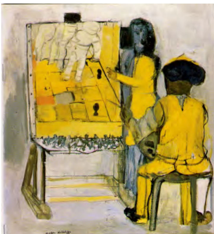
Astronaut 1972 (62 x 75 cm)