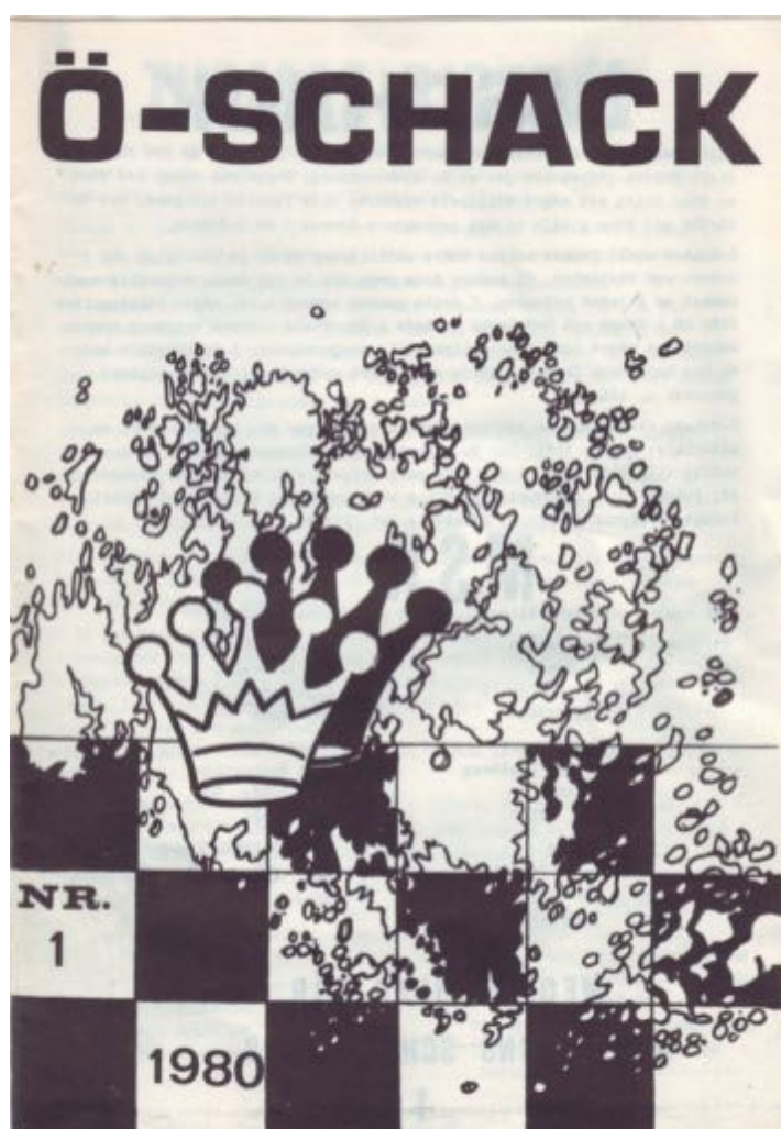
1980 Omslaget till klubbtidsskriften Ö-Schack

Böök blev internationell mästare 1950 och utsågs 1980 av FIDE till "Honorary Grandmaster". Hans största turneringstriumf var segern i Nordiska mästerskapen 1947. Han och Gösta Stoltz stannade båda på nio poäng och skulle göra upp om mästerskapet i en match. Den slutade 4–4 och Böök fick titeln tack vare bättre särskiljningspoäng i huvudturneringen.