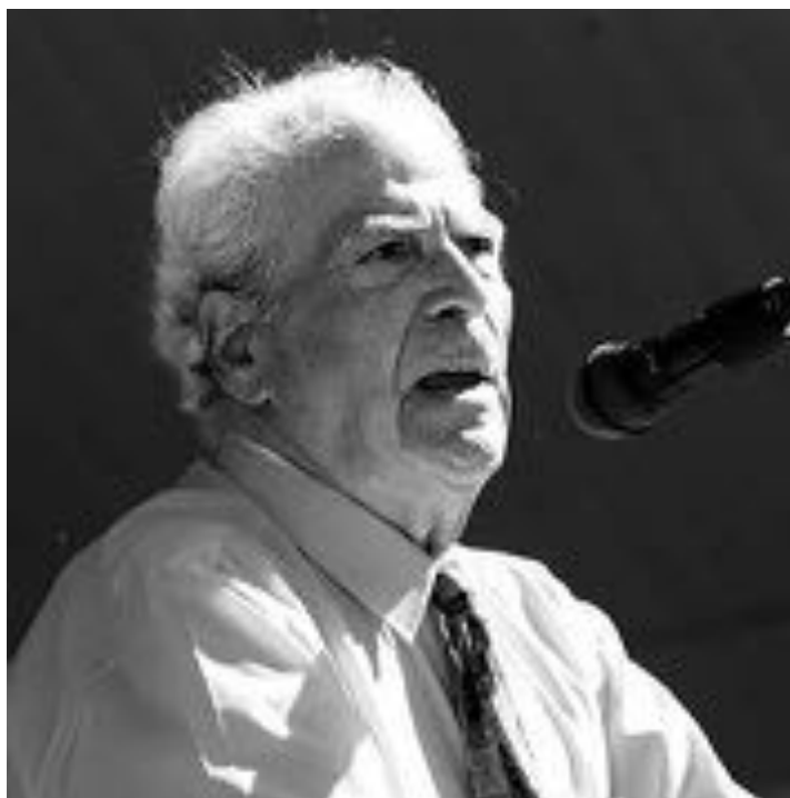
1997 Viking Games: Andor Lilienthal

Spelet försiggick i stora festsalen, och angränsande rum, i Mariehamns stadshus. En nobel miljö där spelarna fick vara ifred – för någon publik kom det aldrig. Men